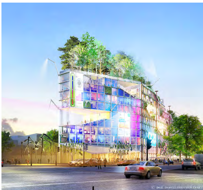
Un pont lumière au delà du périphérique © DGT. (DORELL.GHOTMEH. TANE / ARCHITECTS)

Ces terrasses génèrent des espaces de rencontre aléatoires, des lieux où s'expriment la créativité et le partage.