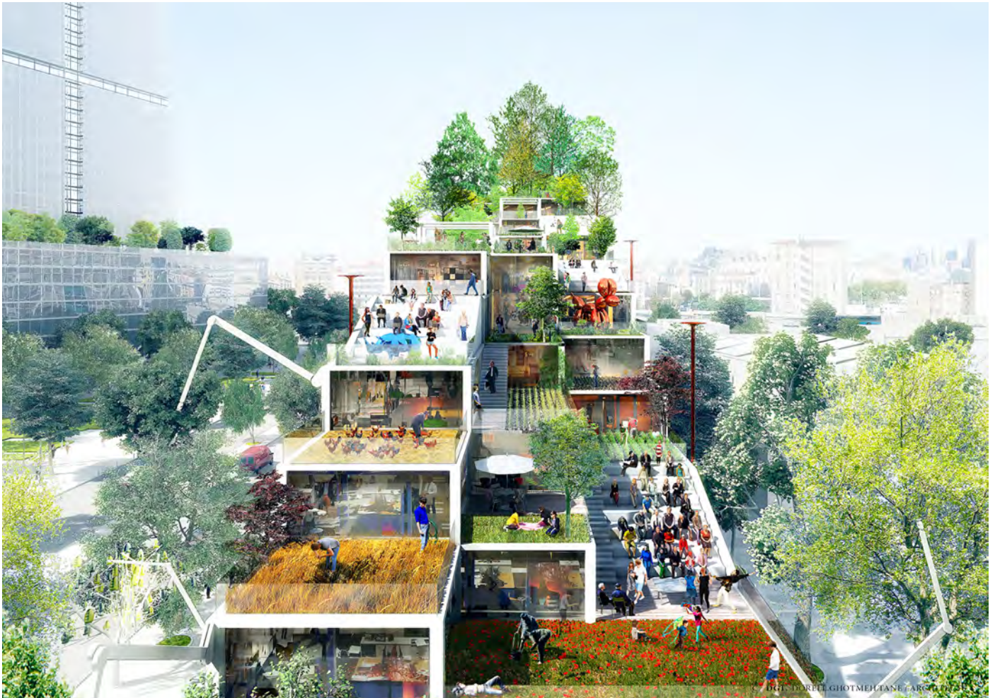
Vue de la toiture de eCOMachine, © DGT. (DORELL.GHOTMEH.TANE / ARCHITECTS)

Comment travaillerons-nous en 2030 ? C'est à cette vaste question que l'équipe CBRE Project, Lina Ghotmeh Fondatrice Associée de DGT et l'ensemble d'une équipe pluri-disciplinaire s'est attelée pour imaginer l'immeuble du futur sur le site N2 de la ZAC Clichy Batignolles dans le 17 ème arrondissement de Paris. Mais au lieu de se focaliser sur la technique technique nous avons voulu mettre l'Humain au cœur de notre réflexion. eCOMachine est le fruit de nos recherches visant à transmuter la matière en élément vivant par l'Humain et pour l'Humain.