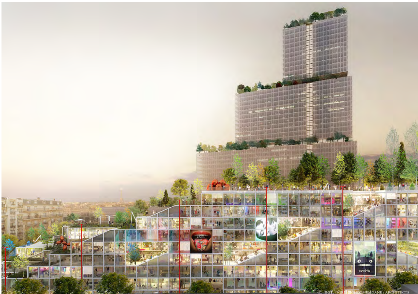
Un bâtiment vivant avec des projections de 'Living Architectures', © DGT. (DORELL.GHOTMEH. TANE / ARCHITECTS)